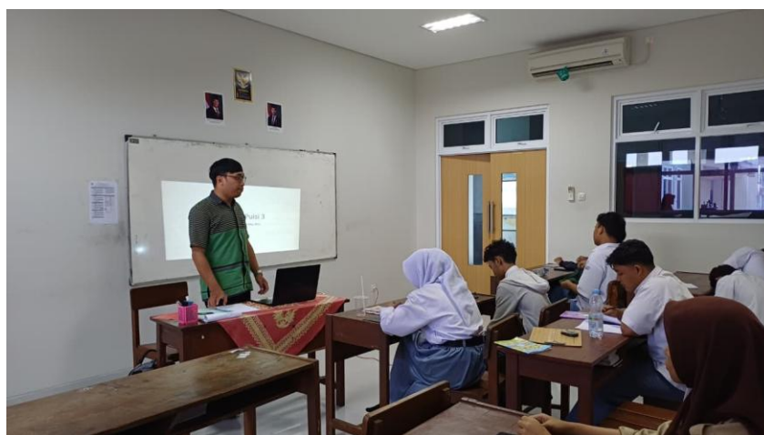
Gambar 9. Dokumentasi Kegiatan Pelatihan Menulis Puisi untuk Siswa SMA PGRI Kasihan Yogyakarta Hari Ketiga