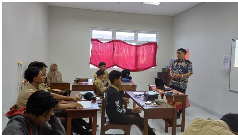
Gambar 8. Dokumentasi Kegiatan Pelatihan Menulis Puisi untuk Siswa SMA PGRI Kasihan Yogyakarta Hari Kedua