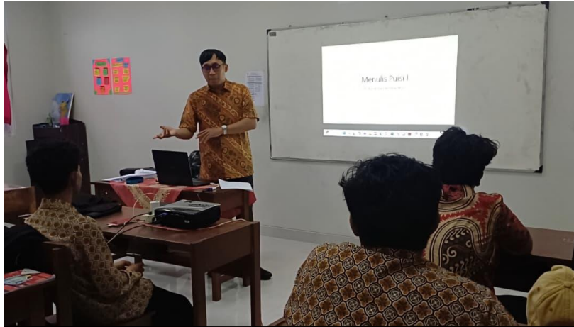
Gambar 7. Dokumentasi Kegiatan Pelatihan Menulis Puisi untuk Siswa SMA PGRI Kasihan Yogyakarta Hari Pertama